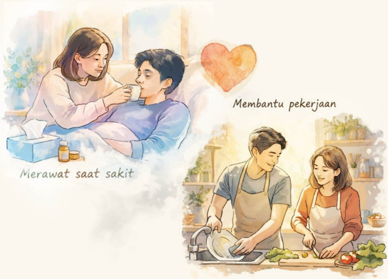
Merawat saat sakit

Perkawinan adalah netral, namun suka duka perkawinan sangat tergantung mereka yang menjalaninya. Telah dimengerti bahwa "karma adalah niat".